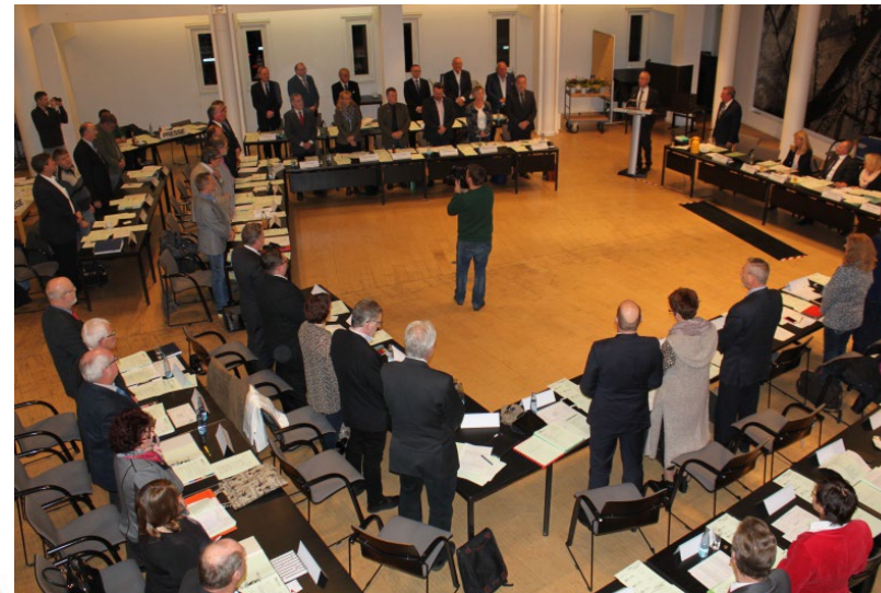
Abb. 7: Kreistag