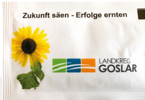
Abb. 8: Zukunft säen