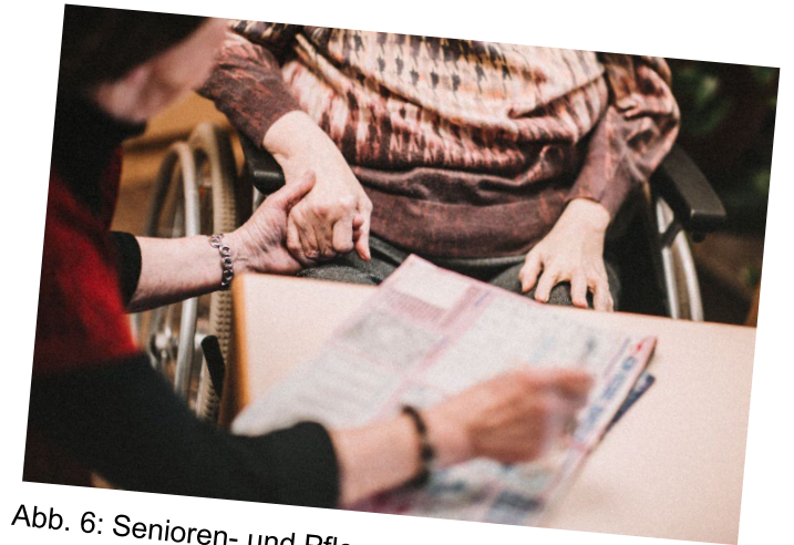
Abb. 6: Senioren- und Pflegestützpunkt, © Landkreis Goslar