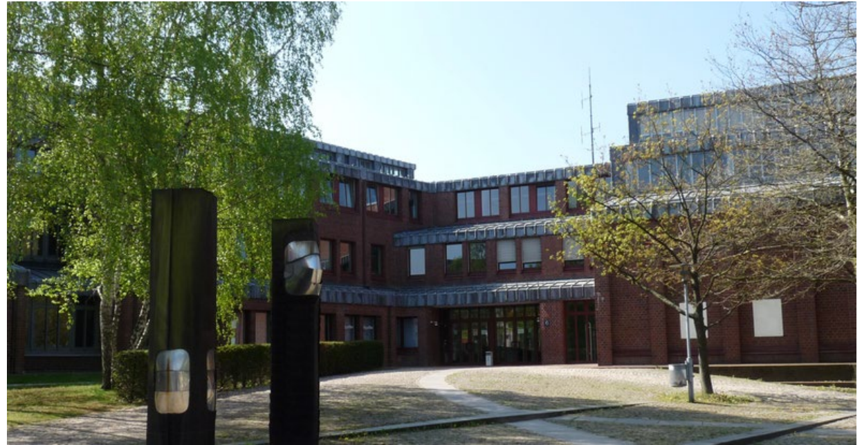
Abb. 2: Kreishaus