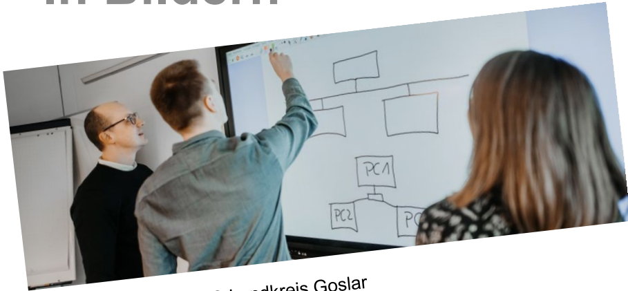
Abb. 5: Mitarbeiter IT