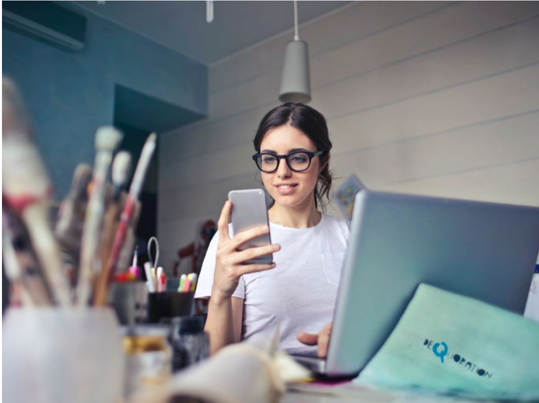
Abb. 4: