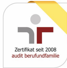
Abb. 10: audit berufundfamilie