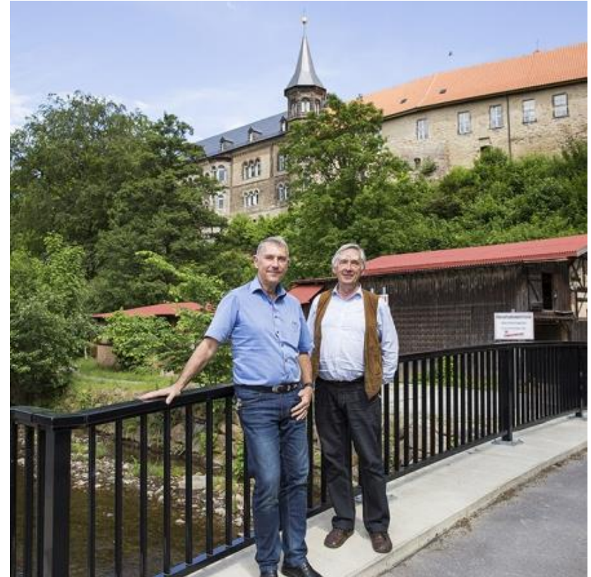
Neue Außenbeleuchtungsanlage für das Kloster Ilsenburg [Studentisches Projekt – Prof. Dr. Ulrich Fischer-Hirchert – 2017]