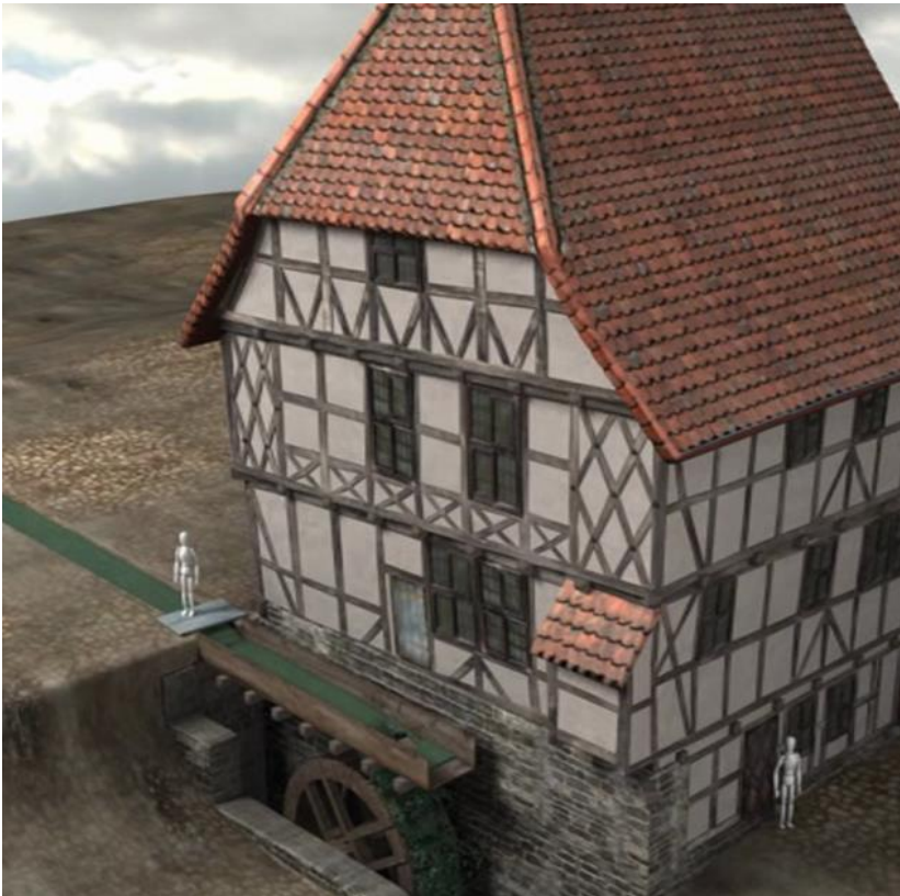
3D-Animation des Museums „Schiefes Haus“ in Wernigerode [Imagefilm und virtuelle Exponate – Prof. Martin Kreyszig – 2011]